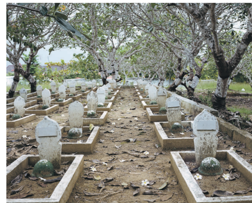
De Heldenbegrafplaats op Madura waar een deel van de doden uit 1947 later herbegraven is.